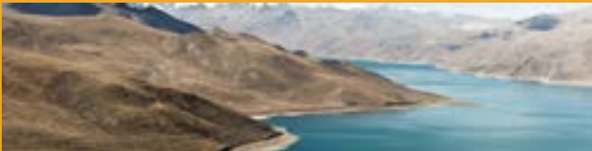
Yamdrok Tso See im Autonomen Gebiet Tibet

Das tibetische Hochplateau besitzt die größten Gletscher- und Schneemassen jenseits des Nord- und des Südpols. Aus ihnen entspringen einige der größten Flüsse Asiens. Vier Millionen Tibeter sind hier sesshaft und rund zwei Milliarden Menschen, ein Viertel der Weltbevölkerung, ist vom Wasser Tibets abhängig. Man bezeichnet die Region deshalb auch als "Dritten Pol" oder "Wasserspeicher Asiens".