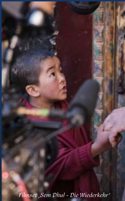
Filmset ‚Sem Dhul - Die Wiederkehr‘

Vorträge, Lichtbilder, Filme, Musik, Fokussierung